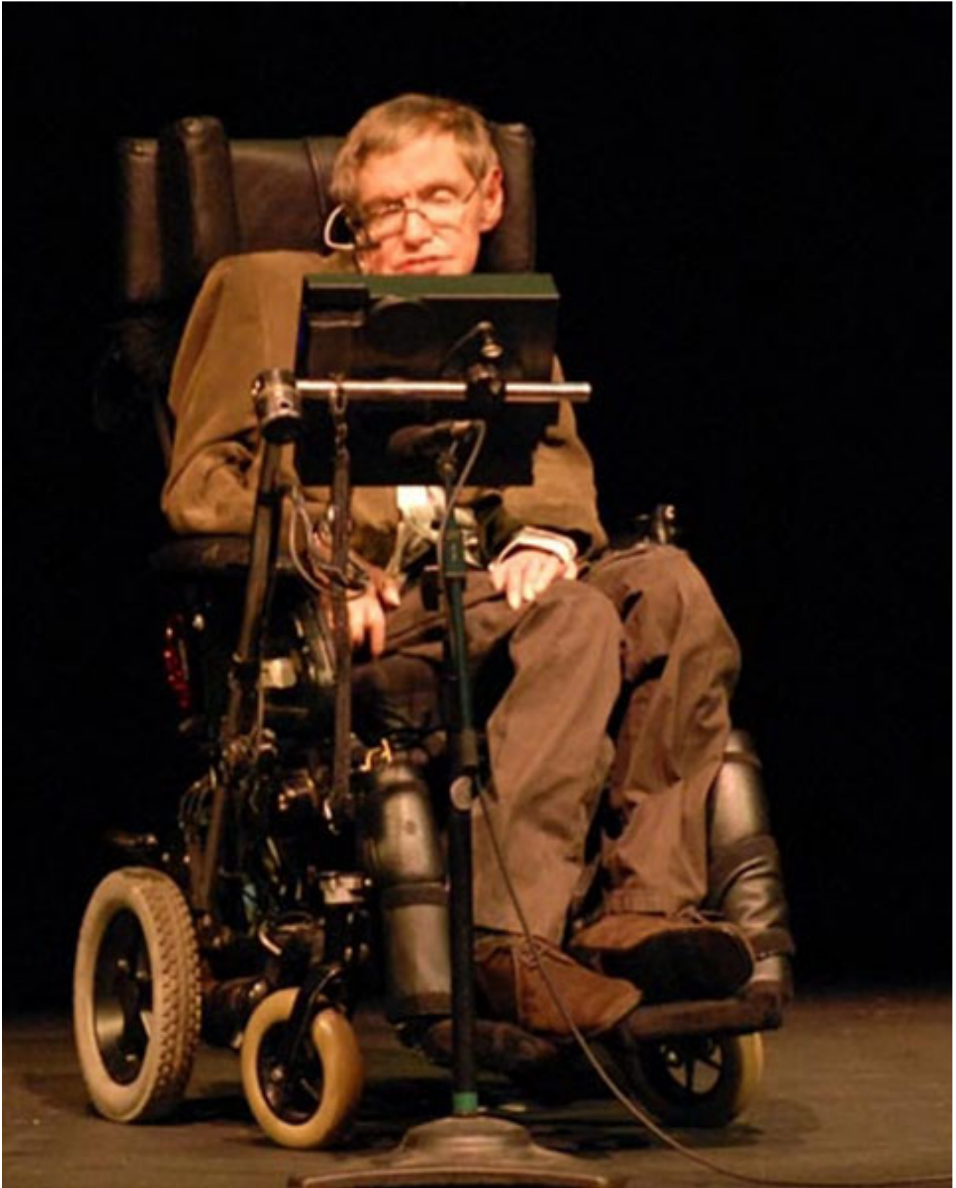
El físico británico Stephen Hawking. Publicado: 21/09/2017 | 05:39 pm