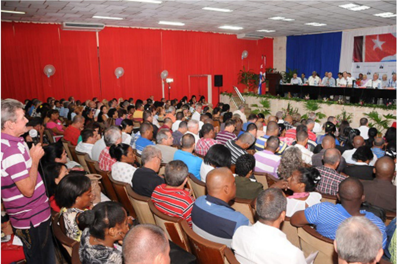
Asamblea Provincial de Balance del PCC en Artemisa. Publicado: 21/09/2017 | 06:20 pm