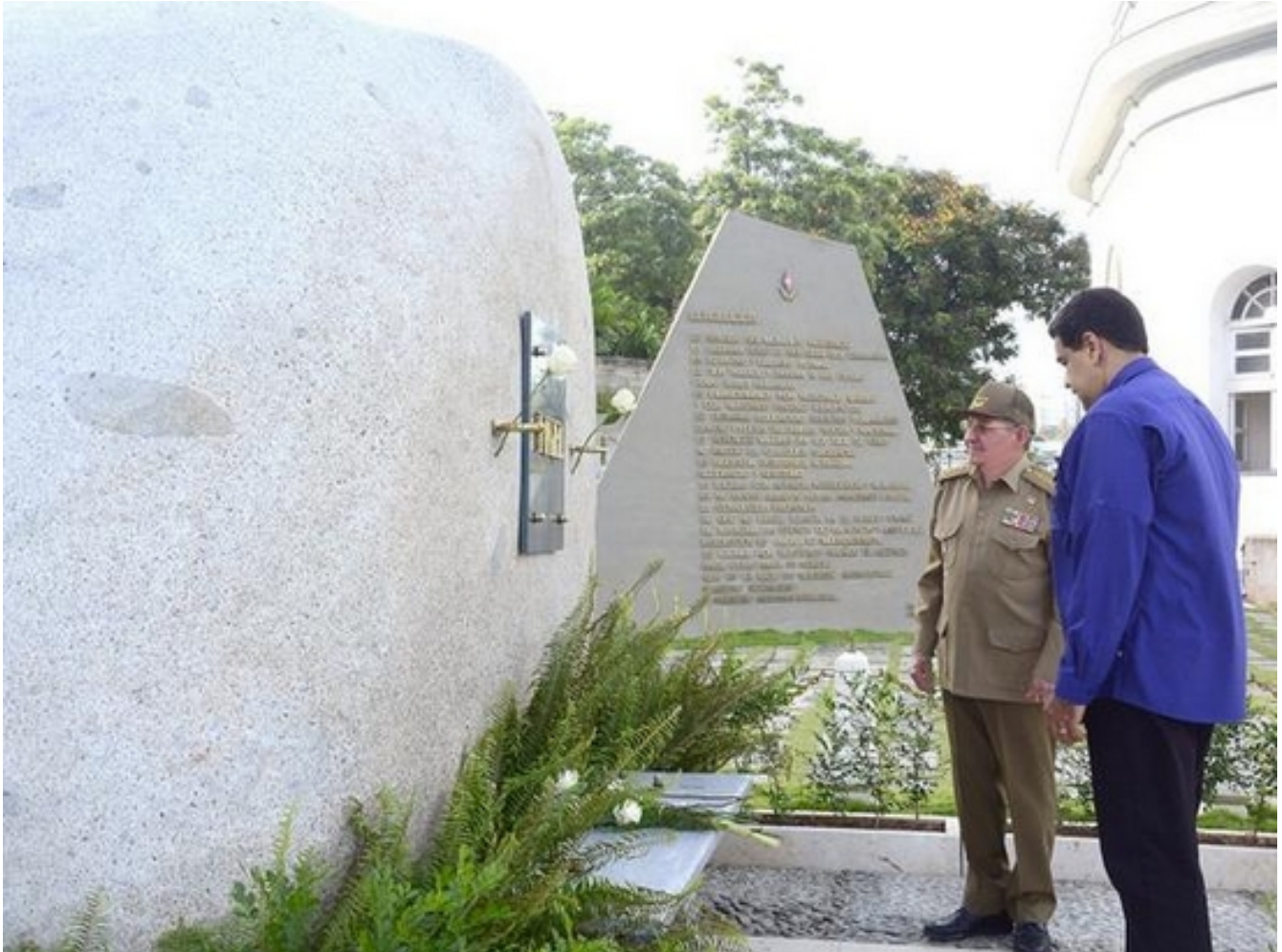
Tributo de Nicolás Maduro a Fidel y Martí en Santa Ifigenia Publicado: 21/09/2017 | 07:03 pm