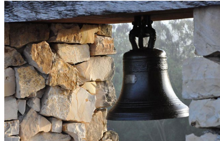
Ruinas del Ingenio La Demajagua.