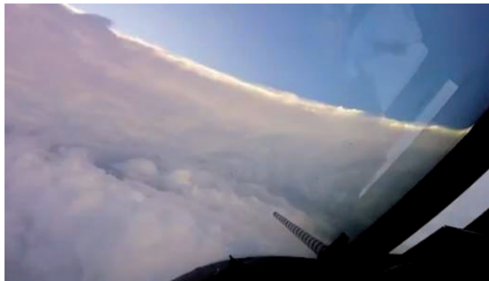
El video del ojo del huracán Irma visto desde un avión que se aventuró hasta el mismo se hizo viral en las redes.

No obstante, también es válido decir que algunos usuarios, como Resistance TV, ya han alzado sus voces en YouTube para llamar la atención sobre este hecho.