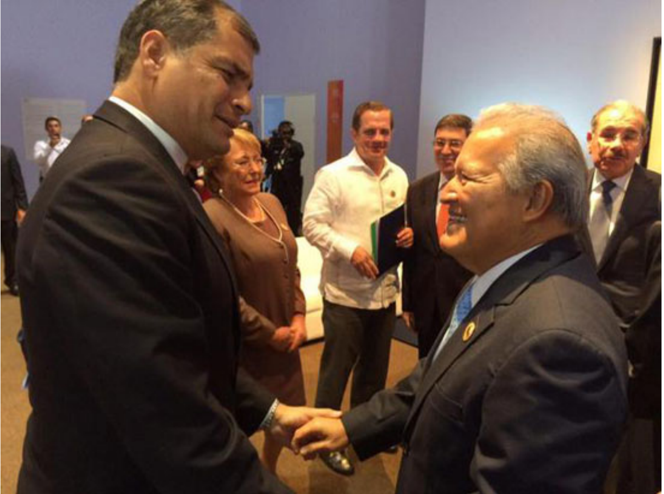
Sánchez Cerén saluda a Rafael Correa quien asumirá la presidencia de la Celac para 2015. Publicado: 21/09/2017 | 06:02 pm

Construyendo juntos otra América Nuestra