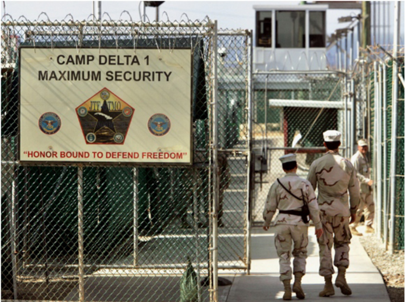
La ilegal cárcel de Guantánamo. Autor: Cubadebate Publicado: 21/09/2017 | 06:10 pm