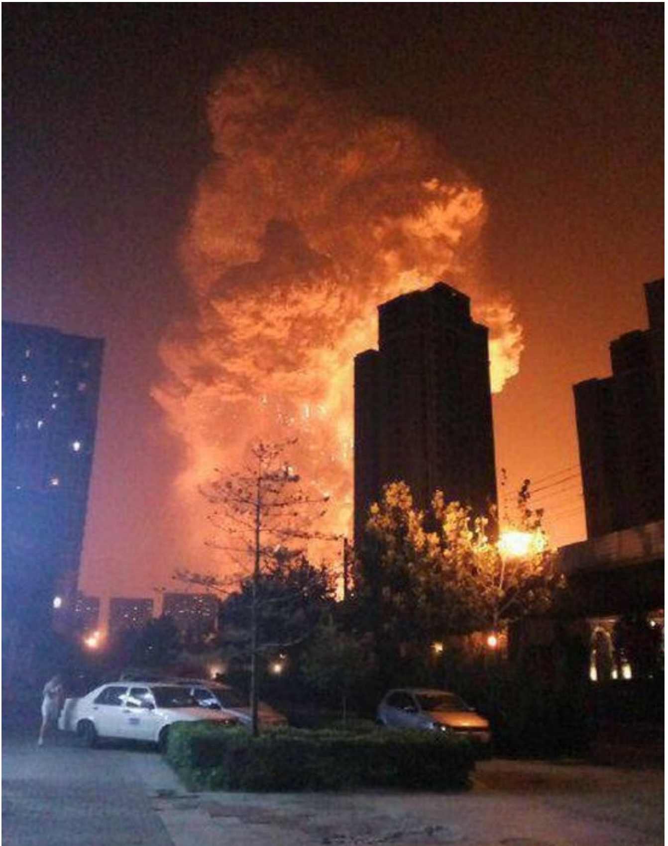
El incendio comenzó a última hora del miércoles y se sucedieron dos grandes explosiones con 30 segundos de diferencia, seguidas de otras menores. Autor: Telesur Publicado: 21/09/2017 | 06:16 pm