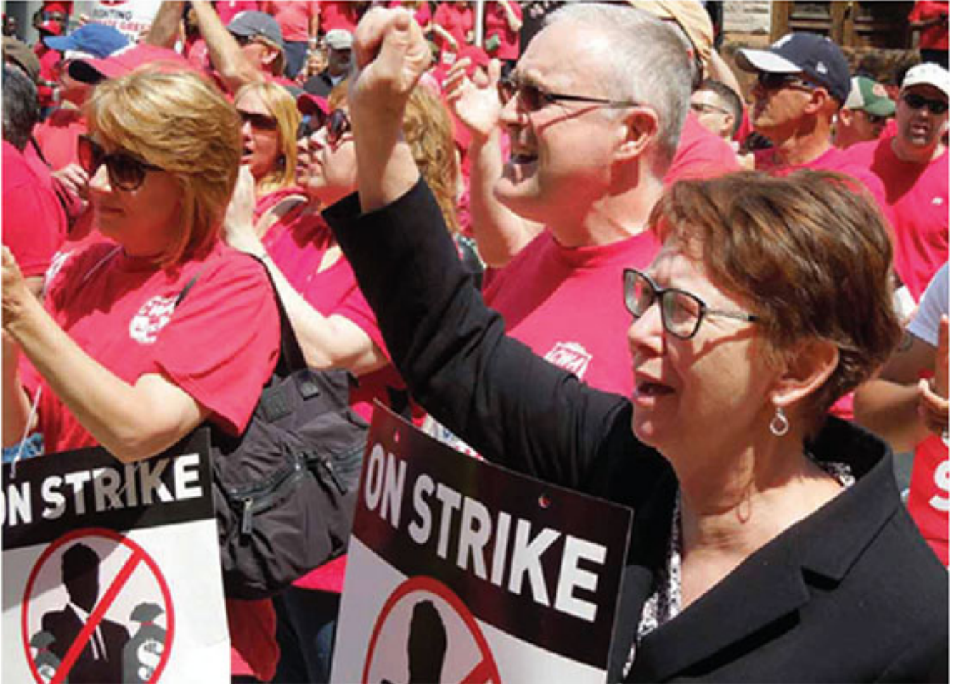
La líder socialista en un mitin de trabajadores de Verizon en huelga en Trenton. Publicado: 21/09/2017 | 06:31 pm