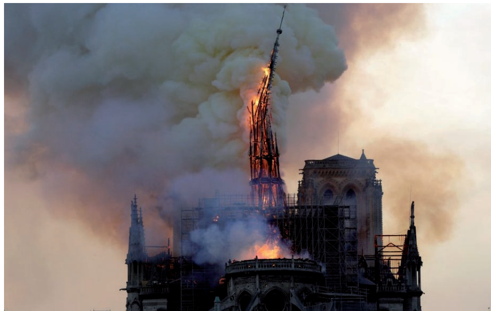
Momento en que se desploma la aguja de la catedral francesa.

Recuerden: 17 de abril, una nueva derrota mercenaria y del imperialismo está a las puertas.