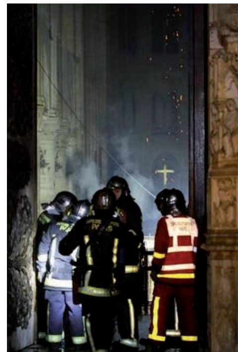
Los bomberos entran a Nuestra Señora de París.

Turistas y franceses, entre los que se encontraba el propio presidente galo Emmanuel Macron, observaban estupefactos el siniestro, comunicó AFP. Muchos aplaudieron a los bomberos a su paso y en medio de la consternación rezaban y cantaban por la catedral de Nuestra Señora de París, a cuya fama también contribuyó Víctor Hugo.