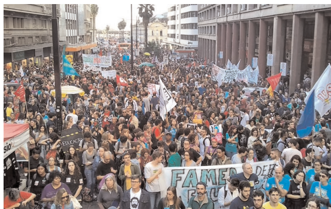
Nuestras armas son los libros.