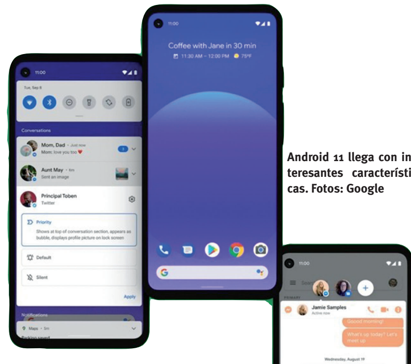
Android 11 llega con interesantes características.

Sin embargo, ya se conocen muchos modelos que recibirán Android 11, los cuales detallamos a continuación, según cada fabricante. Esta lista está conformada por anuncios oficiales de los fabricantes y previsiones de expertos en tecnología de la publicación especializada CNET.